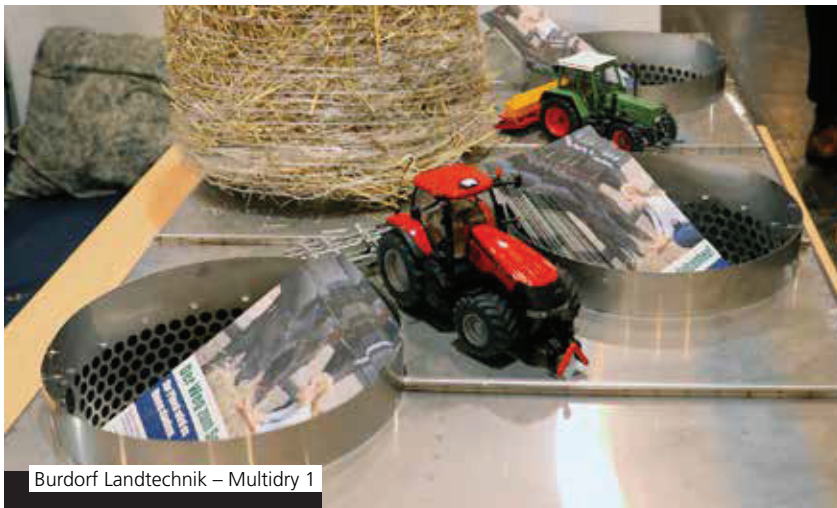
Burdorf Landtechnik – Multidry 1

IPCam 360 RC / HD mit 4-fach optischem Zoom