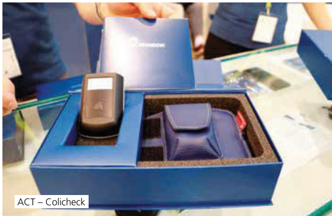
ACT – Coli-check