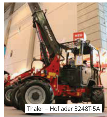
Thaler – Hoflader 3248T-5A

Der Hoflader 3248T-5A kombiniert die klassische Knicklenkung mit einer Allradlenkung und Hundeganglenkung. Dadurch bleibt der Schwerpunkt deutlich in der Mitte und die Lastlinie bleibt innerhalb der Räder, sodass die Standsicherheit und die Wendigkeit erhöht werden.