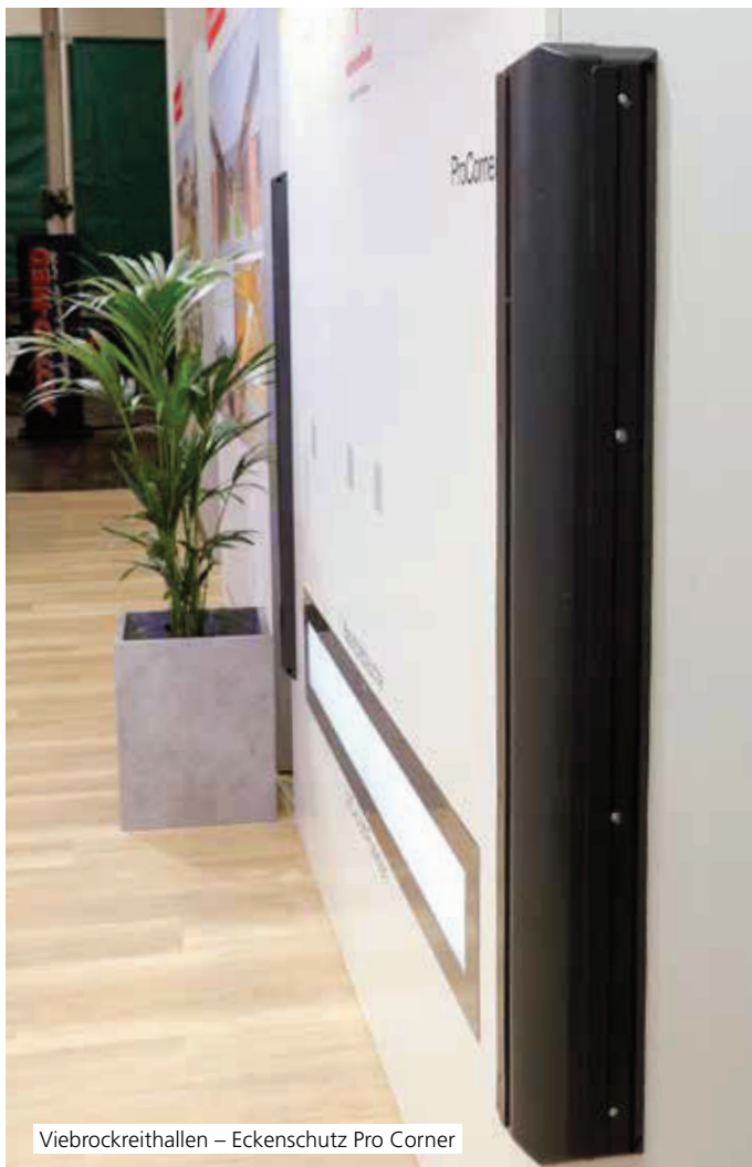
Viebrockreithallen – Eckenschutz Pro Corner