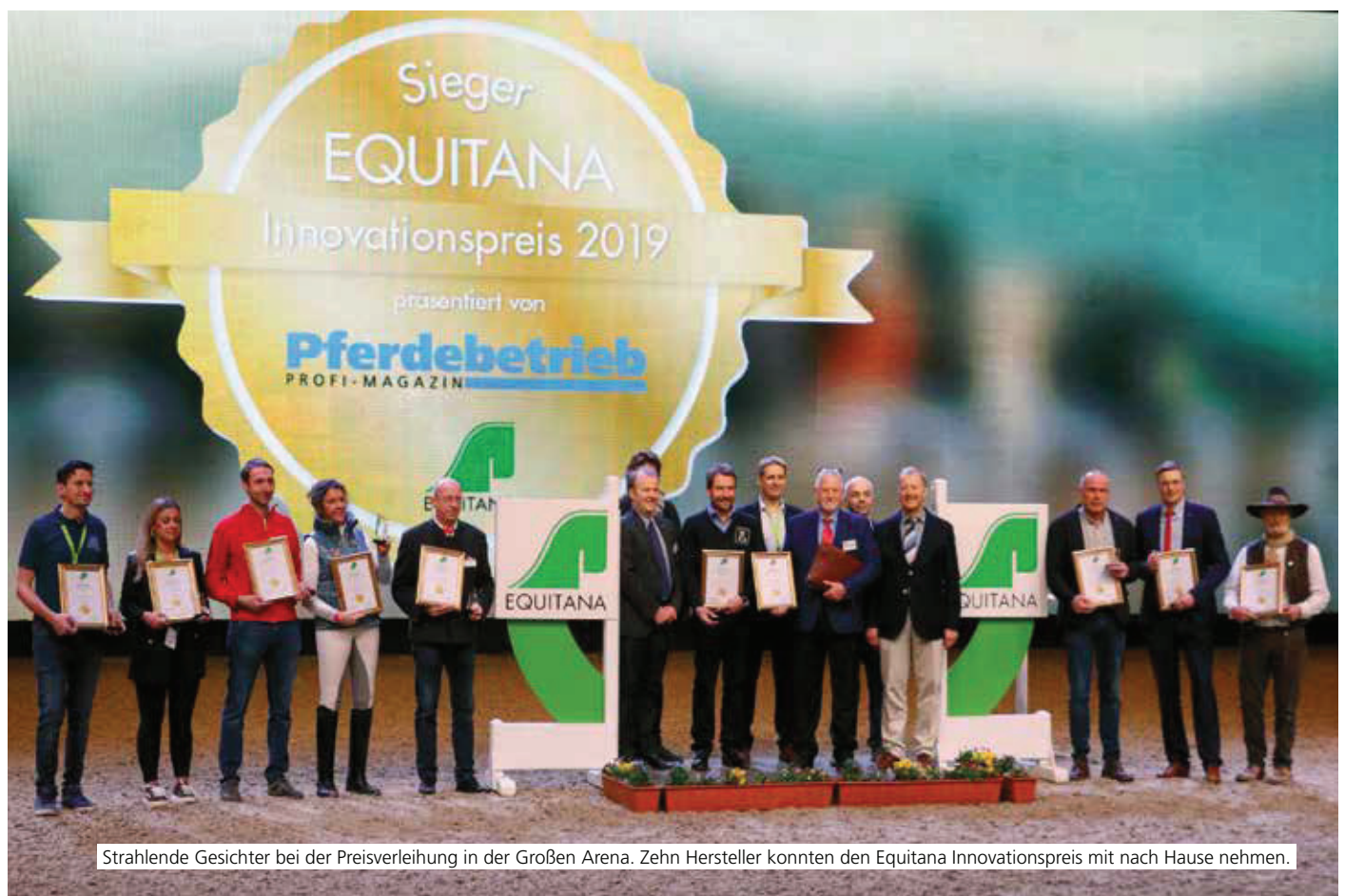
Strahlende Gesichter bei der Preisverleihung in der Großen Arena. Zehn Hersteller konnten den Equitana Innovationspreis mit nach Hause nehmen.