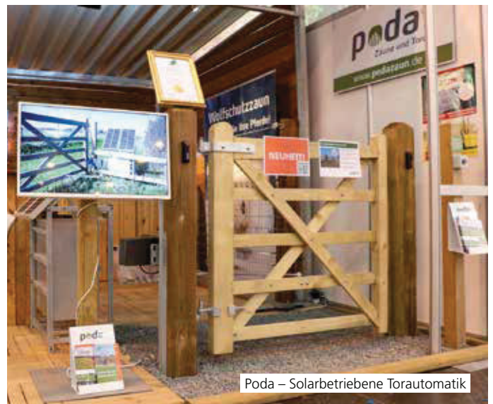
Poda – Solarbetriebene Torautomatik

Der Eckenschutz ist einfach, überzeugt und dient dem Tierwohl, da er die Verletzungsgefahr deutlich reduziert. Das Material ist einfach zu reinigen und kann recycelt werden.