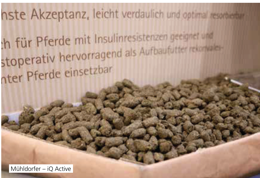
Mühdorfer – iQ Active