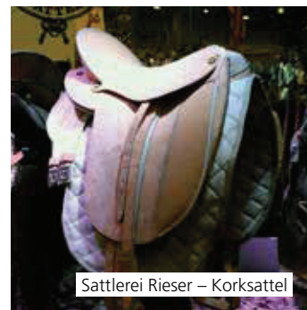
Sattlerei Rieser – Korksattel

Wir möchten den Ansatz, ein neues Material einzusetzen, loben – allerdings muss sich noch zeigen, wie sich das Material langfristig in der Praxis bewährt.