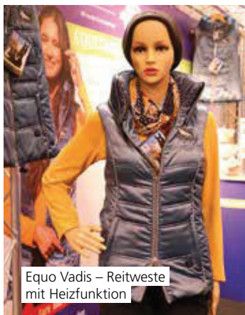
Equo Vadis – Reitweste mit Heizfunktion

Die beheizbare Reitweste von Equo Vadis verfügt über eine Heizfläche im Lendenwirbelbereich, die in drei Stufen reguliert werden kann. Die benötigte Energie liefert ein Akku oder alternativ eine Power-Bank.