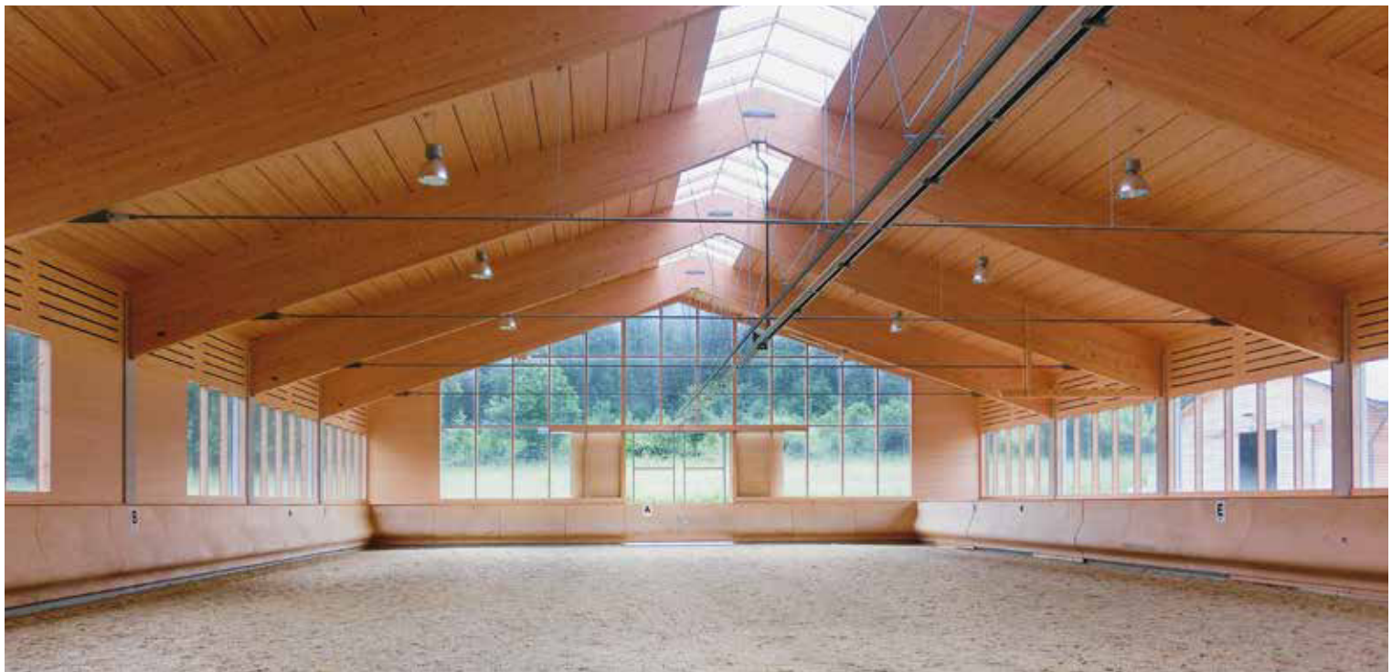
oben: Aussicht ins Grüne – die individuelle Lage sollte bei der Planung berücksichtigt werden. unten: Das Reithallensystem Andrina war für den Equitana Innovationspreis 2017 nominiert.