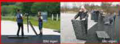
Die Nr. 1 in Größe und Vorleistung. Eigenleistung leicht gemacht.