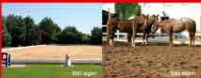
Allwetter-Paddocks für entspannte und zufriedene Pferde

Professionelle Reitplatz- und Paddockbefestigung für Dressurplätze - Springplätze Longierplätze - Westemböden.