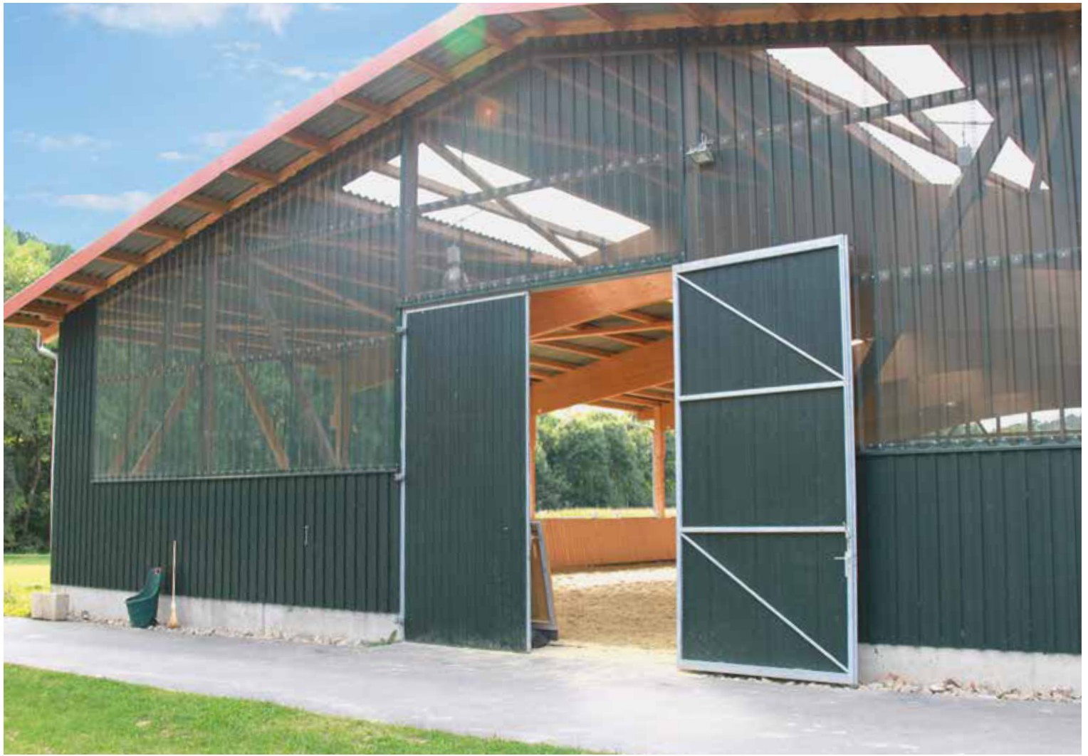
oben: Lochbleche sorgen für Luftaustausch und ausreichend Lichteinfall, gleichzeitig machen sie keine Geräusche. unten: Das Team montiert Bogenbinder und Pfetten.